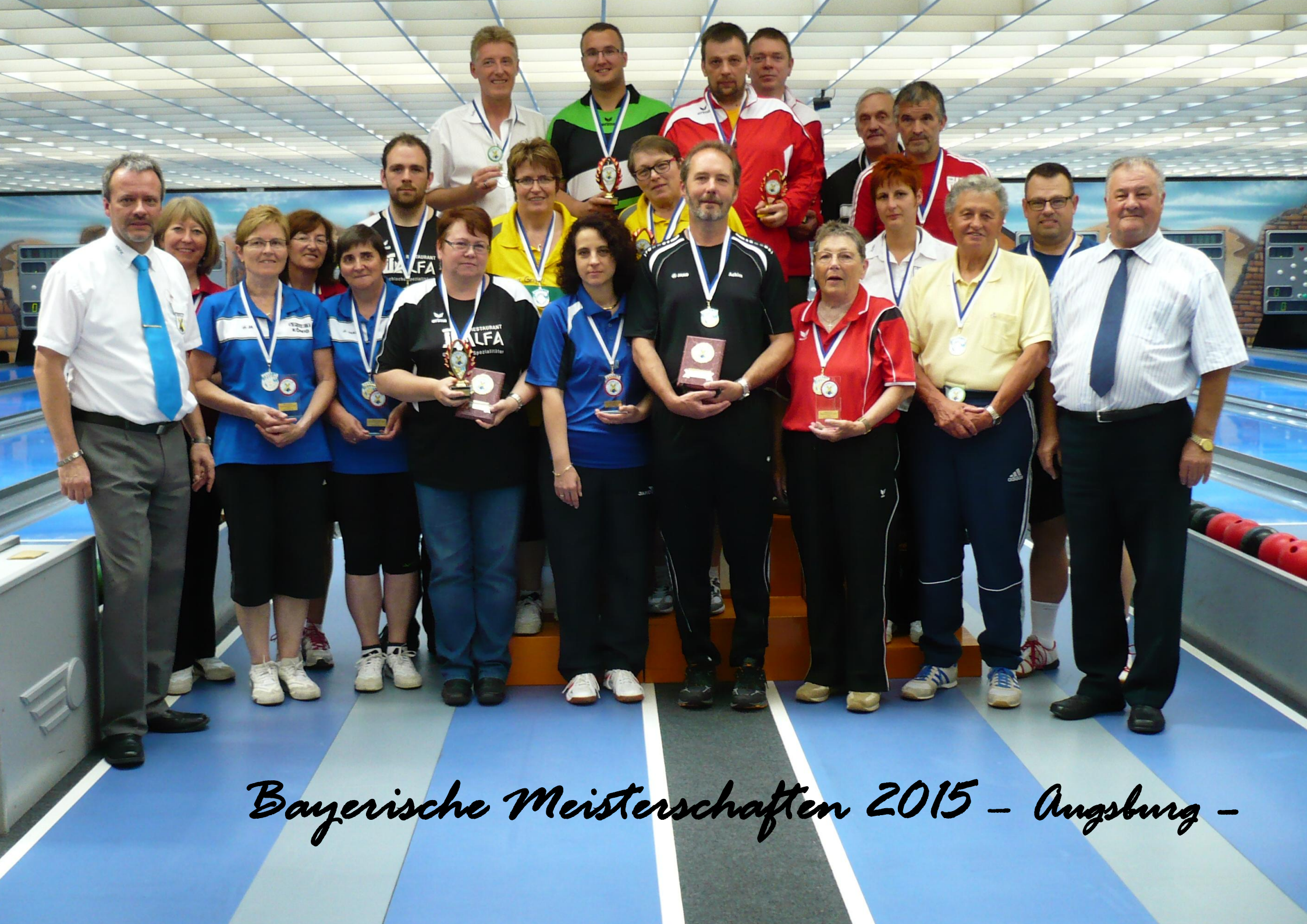
Bayerische Meisterschaften 2015 - Augsburg -