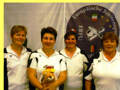
Europapokal in Oggersheim Platz 1 für die KG Berching