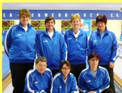
Länderpokal in Villingen Platz 2 für die VBFK-Frauen