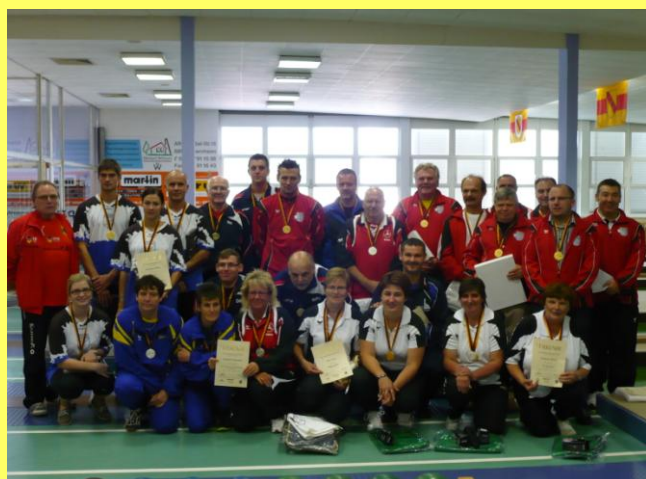
Deutsche Meisterschaft in Viernheim