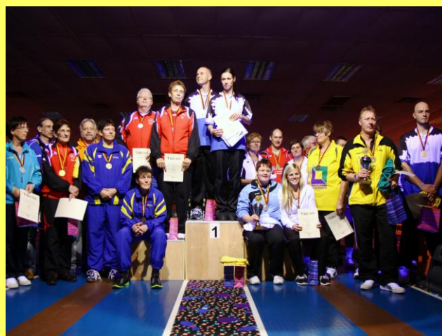
Deutsche Meisterschaft in Oggersheim