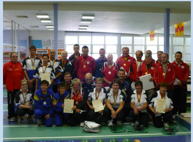
Siegerehrung in Viernheim Deutsche Meisterschaft der Mannschaften