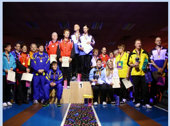
Siegerehrung in Oggersheim Deutsche Meisterschaft der Einzel & Paare