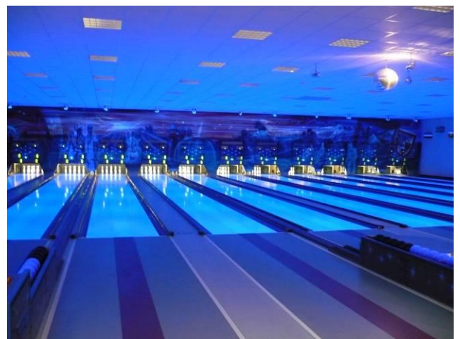
Austragungsort der Deutschen Meisterschaft: Mannschaften in Eppelheim/Baden