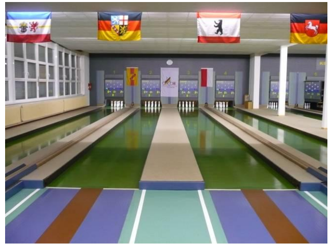
Austragungsort der Deutschen Meisterschaft: Einzel und Paare in Viernheim/Hessen