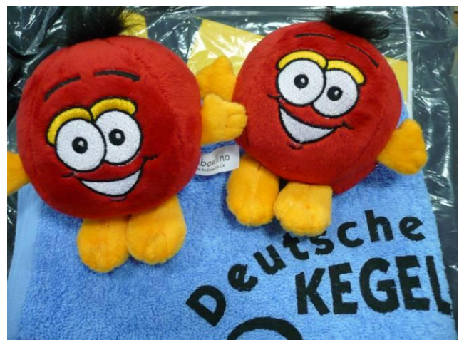
Er brachte den Teilnehmern Glück: Das neue Kegelmaskottchen Keballino

Die vorläufige Planung sieht für 2011 als Austragungsorte Freiburg (Einzel und Paare) sowie Oggersheim (Mannschaften) vor.