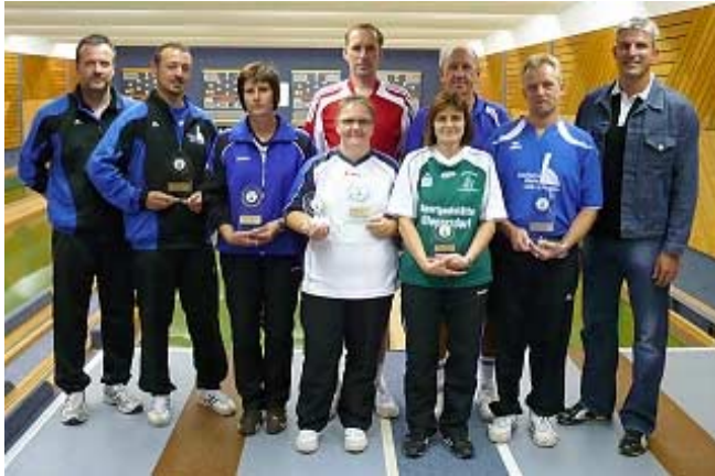
Die Sieger der Bayerischen Tandemmeisterschaft